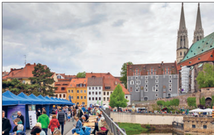
Auf der Altstadtbrücke gab es für die Gäste verschiedene Angebote aus Zgorzelec.

„Besonders freue ich mich, dass über 70 engagierte Institutionen aus der Europastadt, darunter Vereine, Unternehmen und Gastronomen teilnahmen, um das Fest zu einem besonderen Ereignis zu machen“, sagt Oberbürgermeister Octavian Ursu. „Ich möchte allen