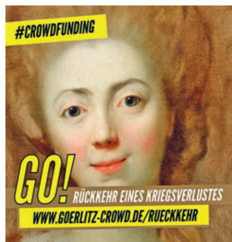
Anton Graff, Bildnis einer jungen Frau, um 1780. Crowdfundig-Aufruf