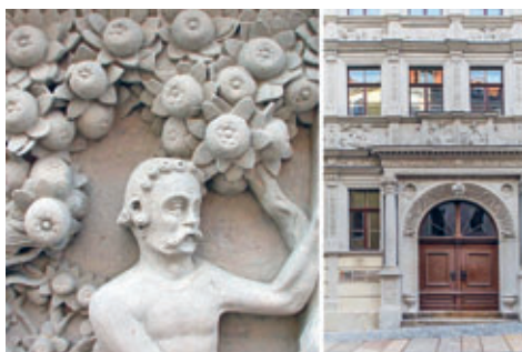
Biblisches Haus Fassade und Detail

Weitere Infos zum Biblischen Haus: https://www.goerlitzer-sammlungen.de/Biblisches-Haus.html