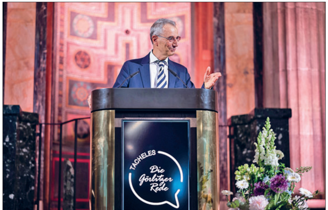
Professor Dr. Michael Wolffsohn im Kulturforum Görlitzer Synagoge

„Tacheles. Die Görlitzer Rede“ ist eine Veranstaltung der Stadt Görlitz in Zusammenarbeit mit dem Förderkreis Görlitzer Synagoge e. V.