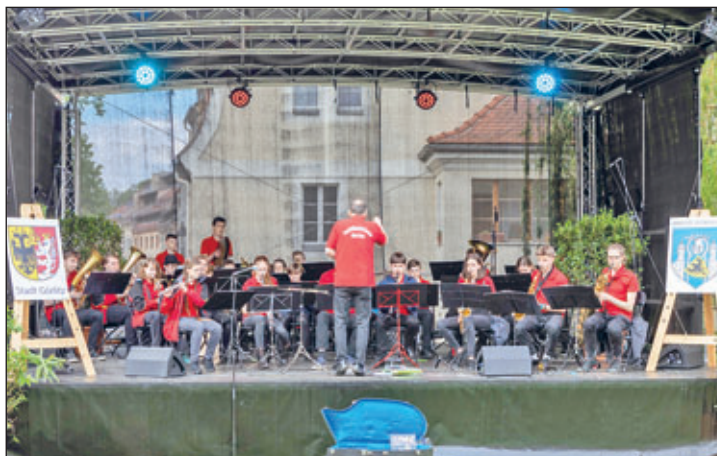
Das Jugendblasorchester der Musikschule Johann Adam Hiller begeisterte auf der Bühne.

Diese Maßnahme wurde mitfinanziert durch Steuermittel auf der Grundlage des vom Sächsischen Landtag beschlossenen Haushaltes.