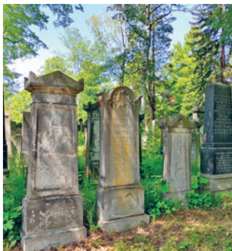
Jüdischer Friedhof

Wandeln Sie mit Historikerin Ines Haaser auf den Spuren jüdischen Lebens in Görlitz und besuchen Sie den jüdischen Friedhof. Erst im Jahre 1847 war in der preußischen Oberlausitz das Gesetz über die „Gleichberechtigung der jüdischen Untertanen“ verkündet worden. Auch in Görlitz setzte daraufhin ein reger Zustrom von jüdischen Bürgern ein, nachdem seit 1395 kein Jude mehr dauerhaft in Görlitz ansässig gewesen war. Um 1900 gehörten etwa 600 Bürger der jüdischen Gemeinde an. Die neuen jüdischen Görlitzer Bürger, obwohl sie nur ein Prozent der Bevölkerung ausmachten, leisteten einen großen Beitrag zum politischen, kulturellen und gesellschaftlichen Leben. Bereits 1849 erwarb die jüdische Gemeinde das Grundstück an der Biesnitzer Straße, auf dem sich auch heute noch der jüdische Friedhof befindet. Zahlreiche Grabmale und Steine haben sich erhalten und erzählen von Görlitzer Geschäftsleuten, Wissenschaftlern und einfachen Leuten. Treffpunkt ist am Eingang des Jüdischen Friedhofs an der Biesnitzer Straße. Eintritt normal 8 Euro, 6 Euro ermäßigt. Männer werden gebeten, eine Kopfbedeckung zu tragen.